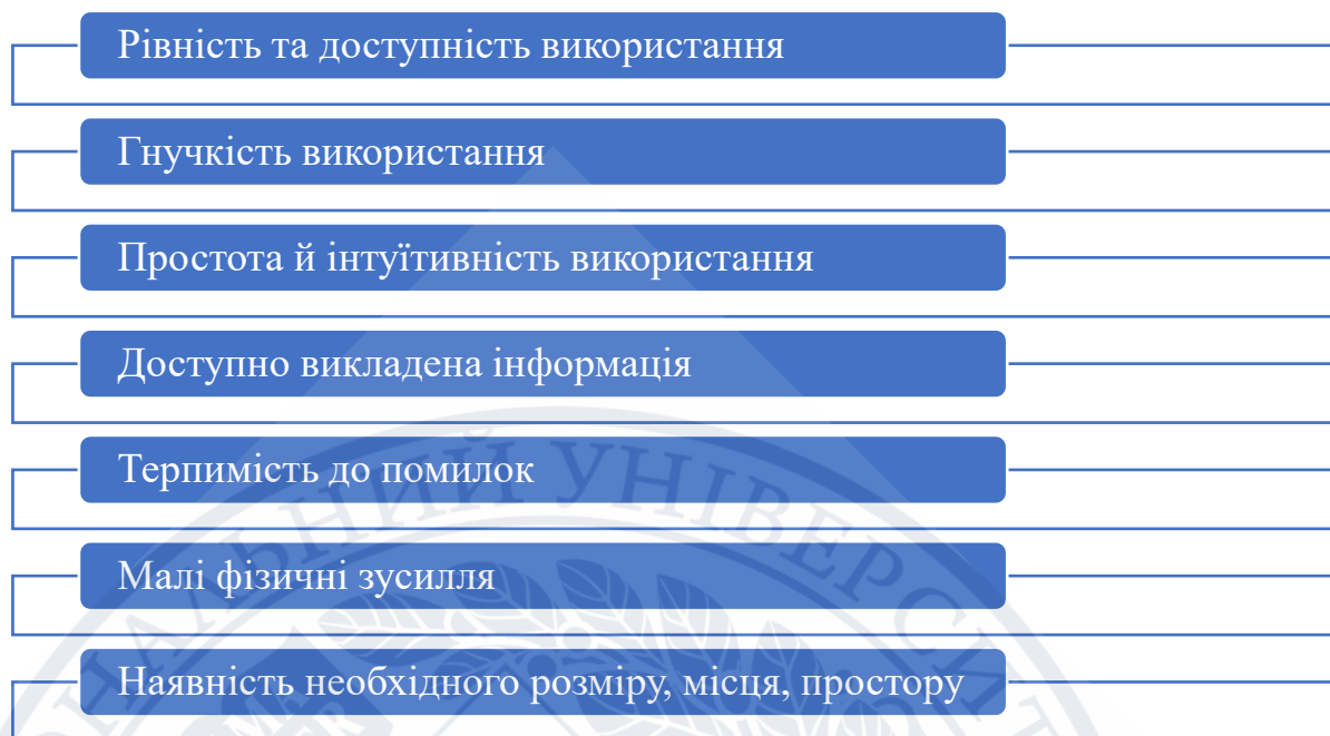
Рисунок 2.1 Принципи при організації та плануванні універсального бібліотечного дизайну [складено автором за 4].

Бібліотечний дизайн останнім часом не є вираженою новизною для бібліотечних систем України. Провідні фахівці в галузі бібліотечної справи щороку створюють нові дизайнерські рішення, беруть участь у конкурсах, що стосуються бібліотечного простору. Загалом не стоять на місці, а рухаються в інноваційному напрямку.