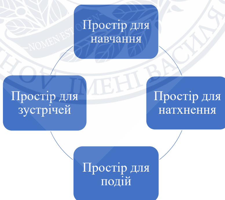
Рисунок 1.1 Чотири простори бібліотеки [складено автором]

У виданні представлено модель бібліотеки, що поєднує чотири простори, що зображено на Рисунку 1.1.