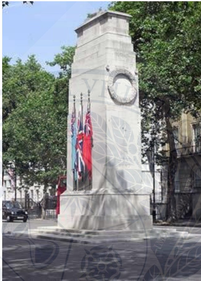
Рис. 4. Кенотаф, Уайтхолл, Лондон – The Cenotaph, Whitehall, London