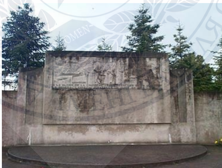
Рис. 3. Пам'ятник à la Vème armée française – Гіз – Monument à la Vème armée française – Guise