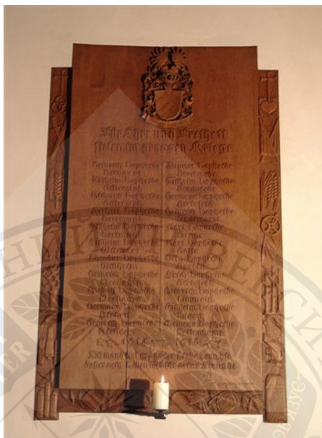
Рис. 2. Дощечки Дофеїдів – Plaketten Dorpheide