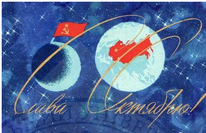
Рис.7. «Слава Жовтню!», 1967 р. [39]