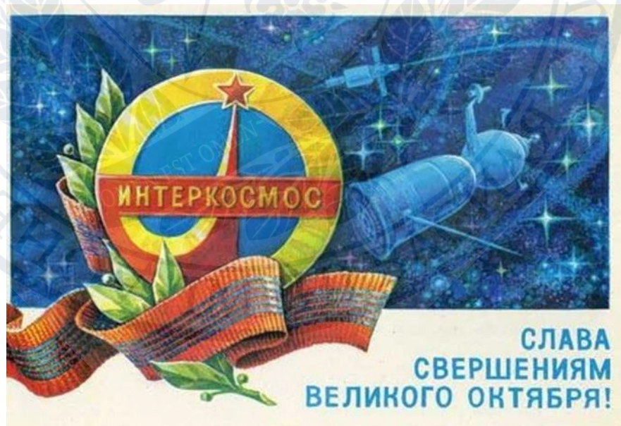
Рис.6. Інтеркосмос. Слава звершень Великого Жовтня!, 1979 р. [39]