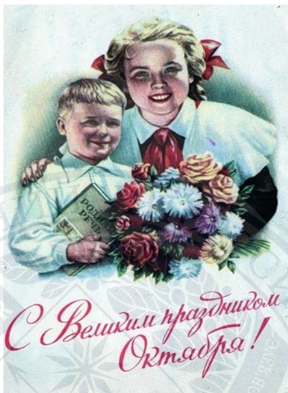
Рис.3. «С Великим праздником Октября!», 1953 р. [39]