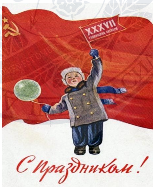
Рис.2.«37 роковини Жовтня. Зі святом!», 1954 р. [39]