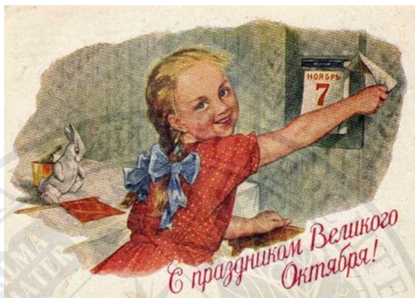
Рис.1. «Зі святом Великого Жовтня!», 1954 р. [39]