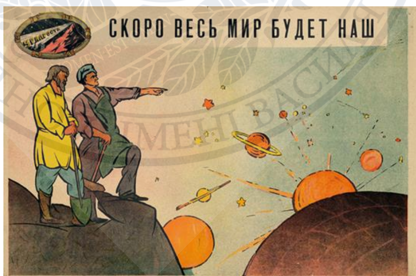
Рис.9. Скоро весь світ буде наш, 1919 р. [4, с.856 ]