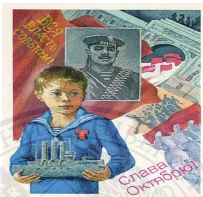
Рис.5. "Вся влада Радам! Слава Жовтню!» [39]