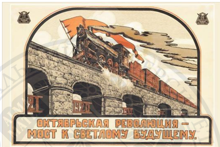
Рис.10. Жовтнева революція - міст до світлого майбутнього, 1921 р.