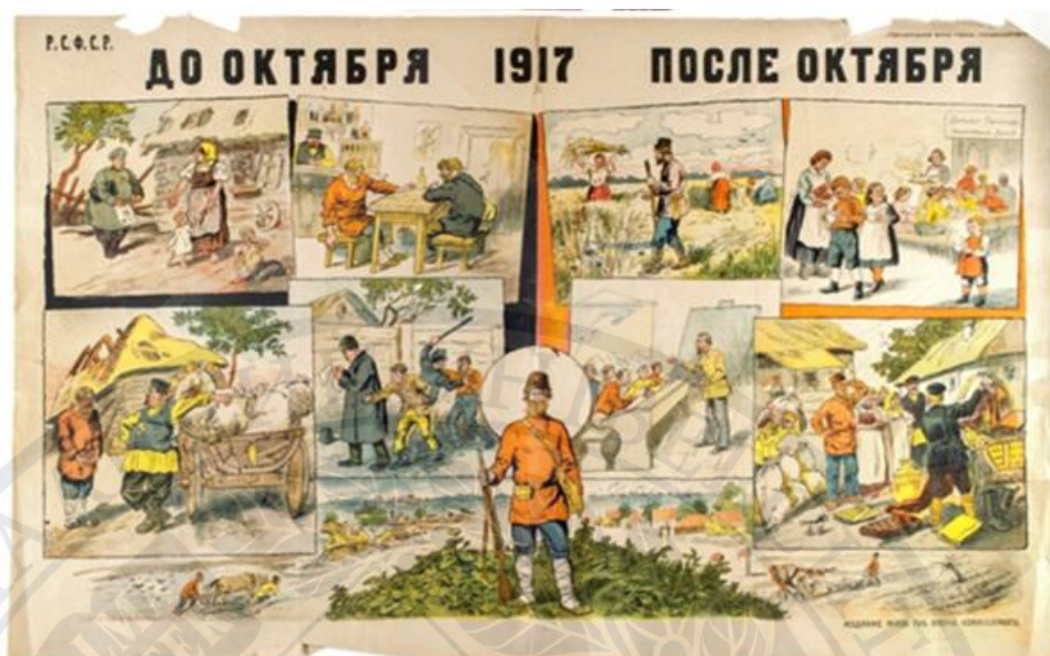
Рис.8. До жовтня. 1917. Після Жовтня, 1920 р. [4, с.858].