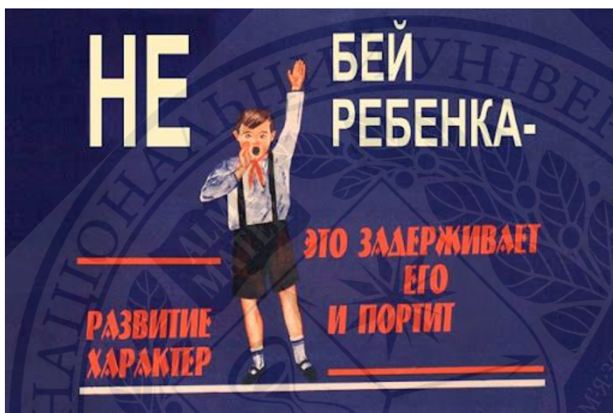
Рисунок А.1. Плакат «Не бий дитину- це затримує її розвиток та шкодить її характеру», 1929 р.