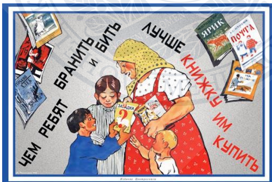
Рисунок А.2. Плакат «Ніж дітей сварити й бити, краще книгу їм купити», 1928 р.