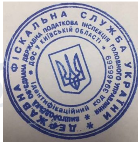
Рис. 1.1. Печатка органів ДФС

Через безліч скарг про відкриття кримінальних справ безпідставно, процес посиленого тиску на малий та середній бізнес. Було проведено цілий ряд люстрацій. Масова люстрація була проведена у 2014 році та з 2015 року почала функціонувати «гаряча лінія» спрямована на протидію та профілактику корупції в органах ДФС [5].