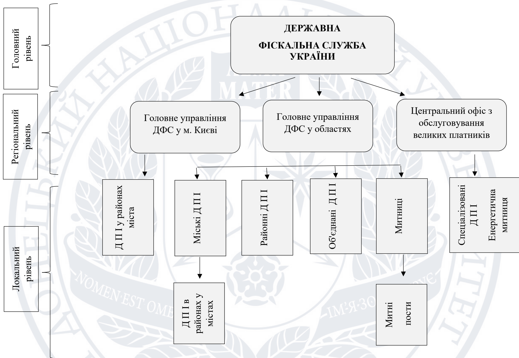
Рис. 1.2. Структура ДФС України