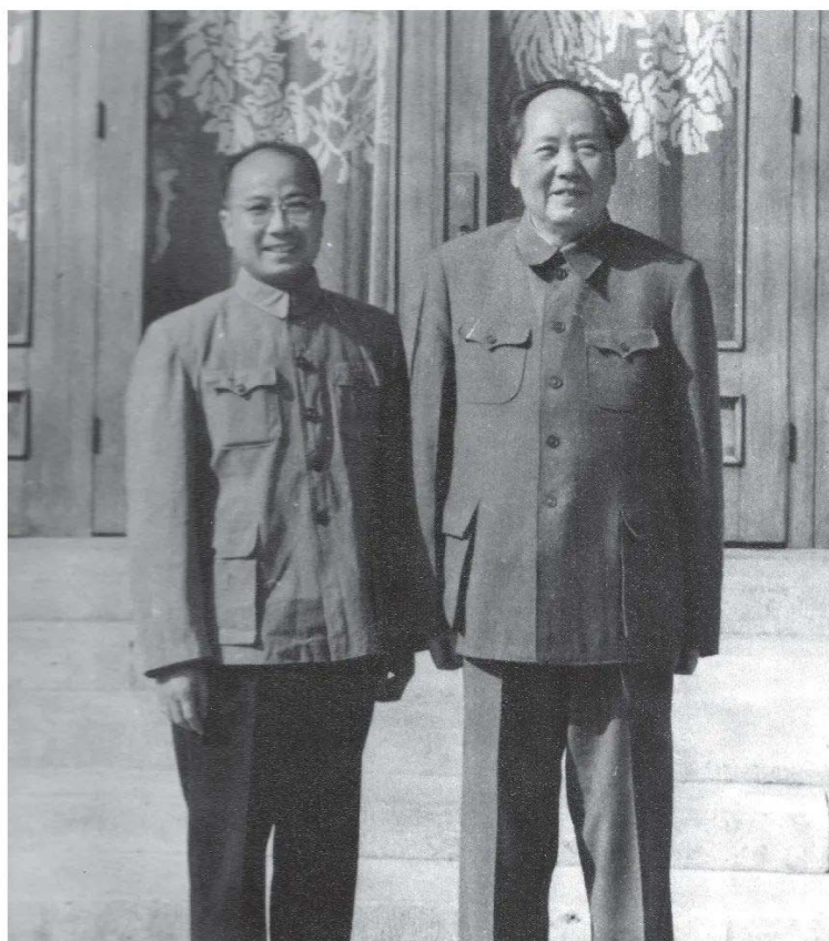
1962年初夏, 毛泽东与叶子龙合影

Приклад класичного «костюму Мао», 1949 р. [102].