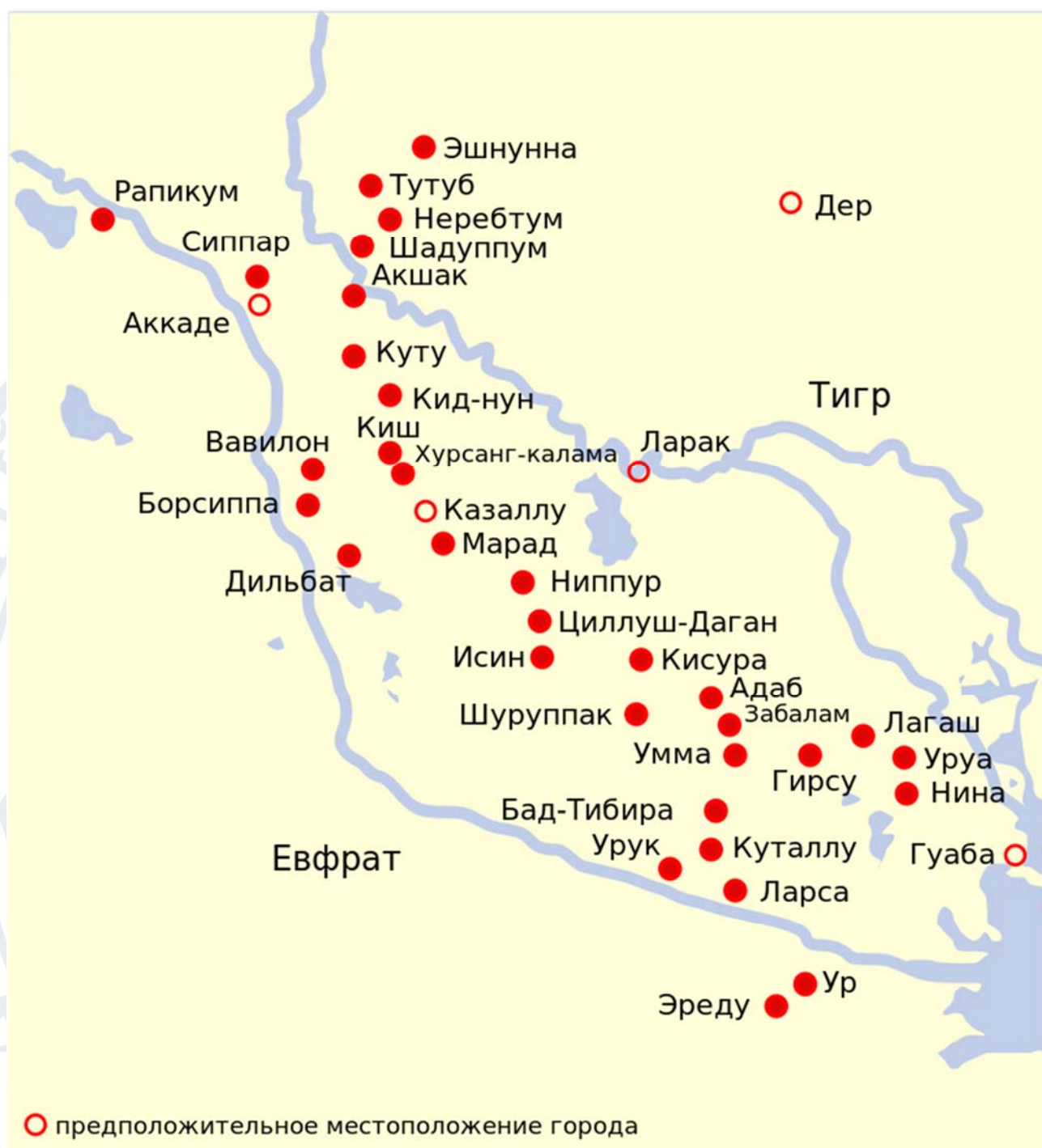
Мал.6 Стародавні міста Месопотамії