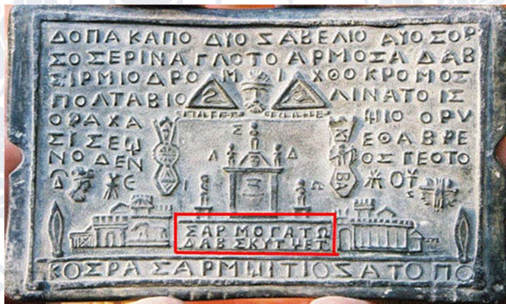
Мал. 5 Свинцева копія однієї з таблиць

Справжня історія фракійців (гето-даків) була написана на золотих таблицях, - навмисно знищена.