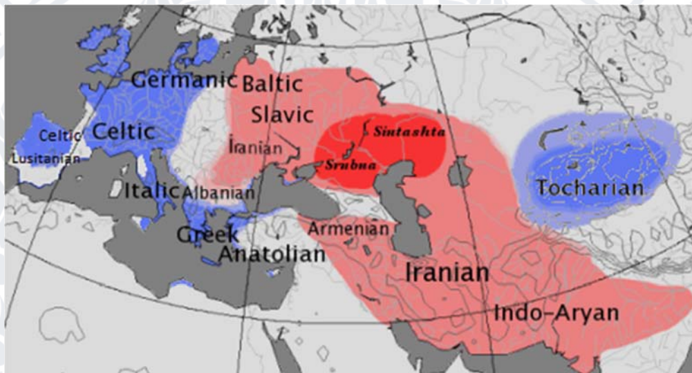
Мал.1 Карта індоевропейських лінгвістичних ареалів Кентум (синій) та Сатем (червоний) близько 500 г. до н. е.

Склад. Індоевропейська сім'я включає: слов'янську, балтійську, німецьку, кельтську, італійську, романську, іллірійську, грецьку, анатолійську (хетто-лувійську), іранську, дардську, індоарійську, нурістанську, албанську, вірменську мови.