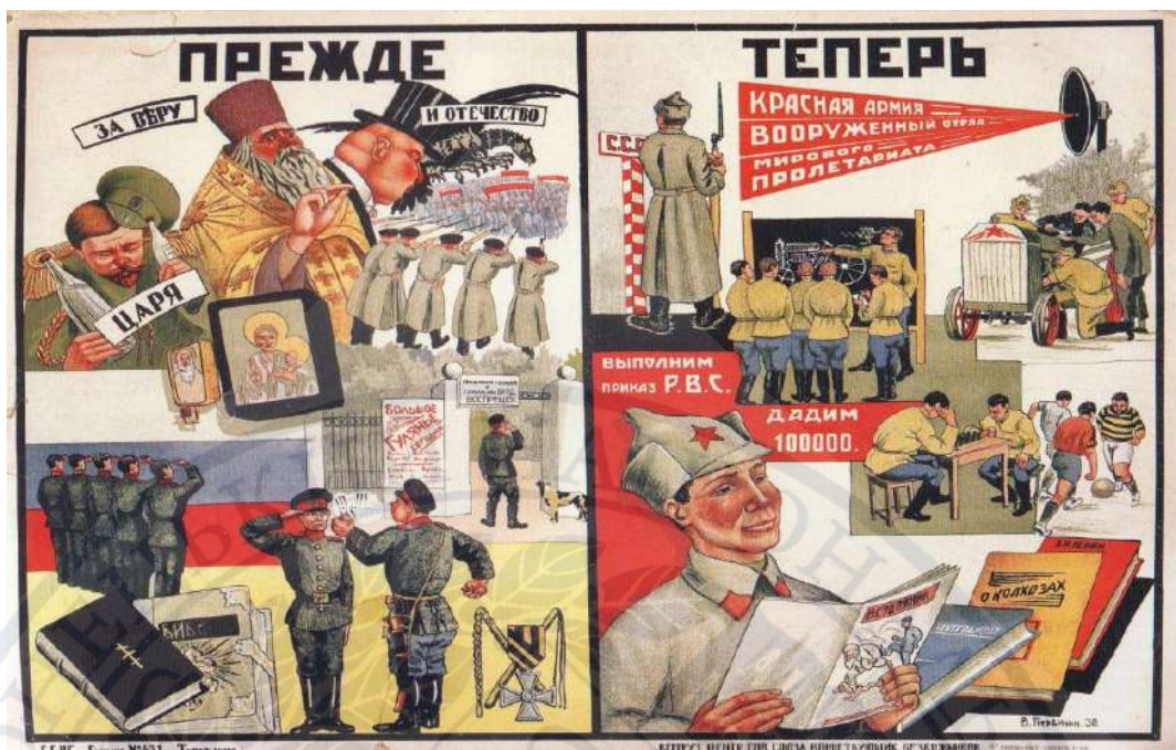
Рисунок Д. 3. Антирелігійний плакат.