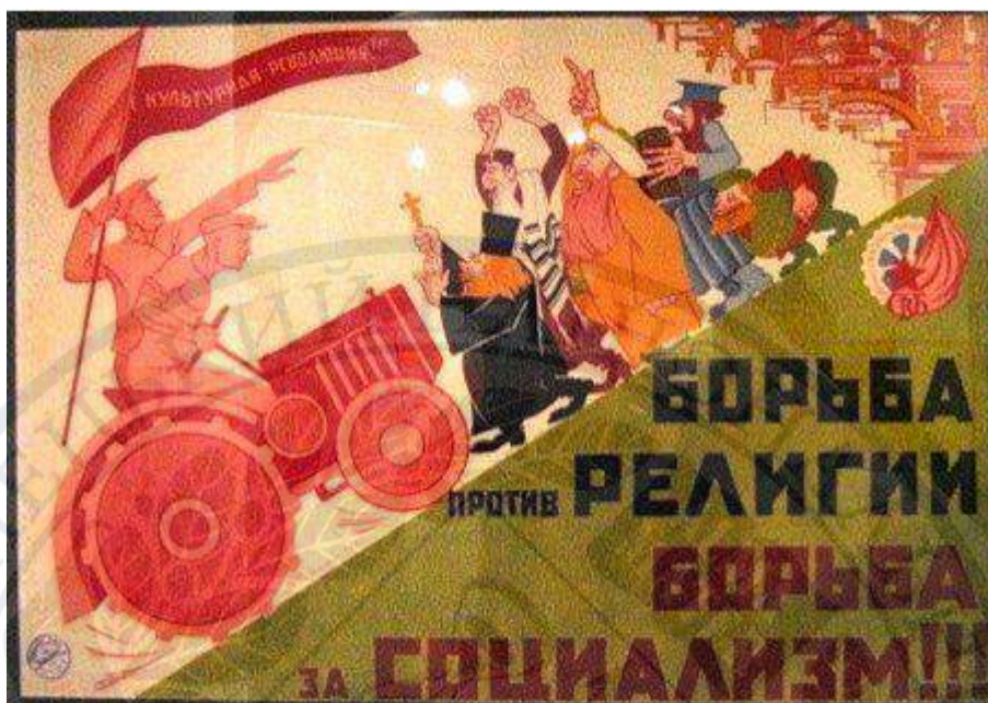
Рисунок Д. 1. Антирелігійний плакат.