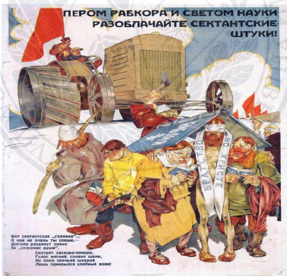
Рисунок Д. 4. Антирелігійний плакат.