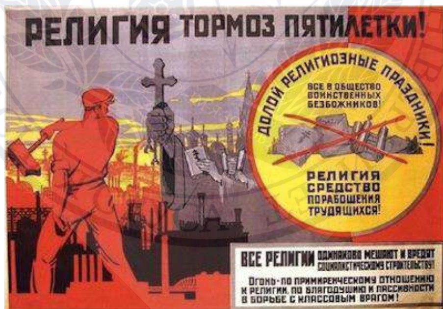
Рисунок Д. 2. Антирелігійний плакат.