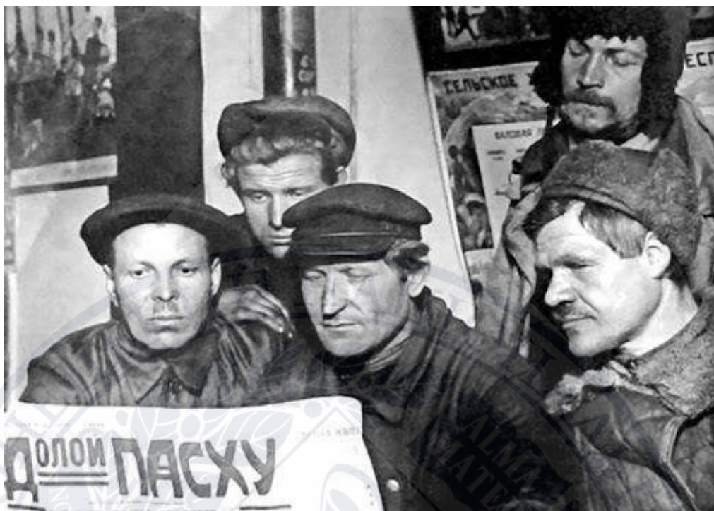
Рисунок Д. 7. Пропагандистське фото до Свята Великодня.