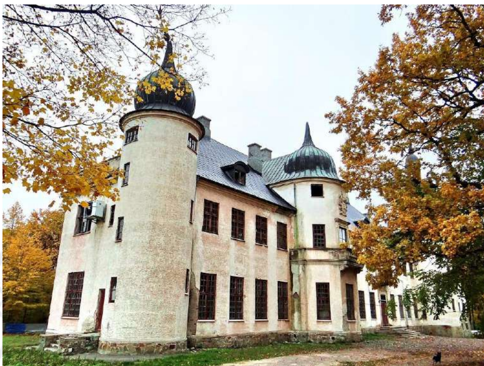
Рис.15. Садба Шувалових-Потоцьких у Тальному (Черкаська область)