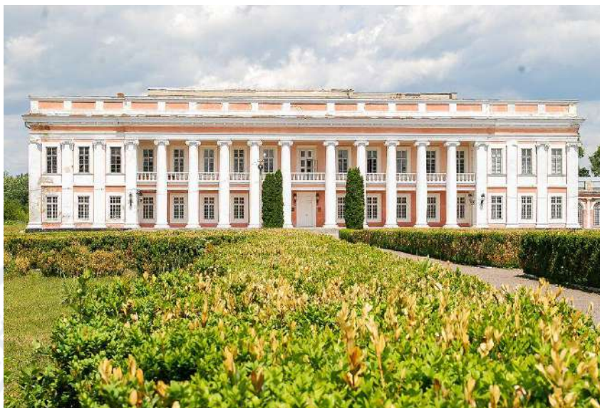
Рис.5. Палац Потоцьких у Тульчині (Вінницька область)