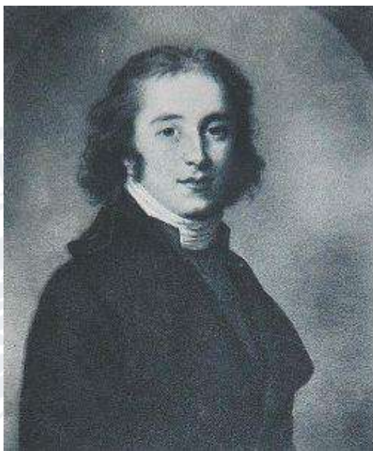
Рис. 1. Станіслав Щенсний Потоцький