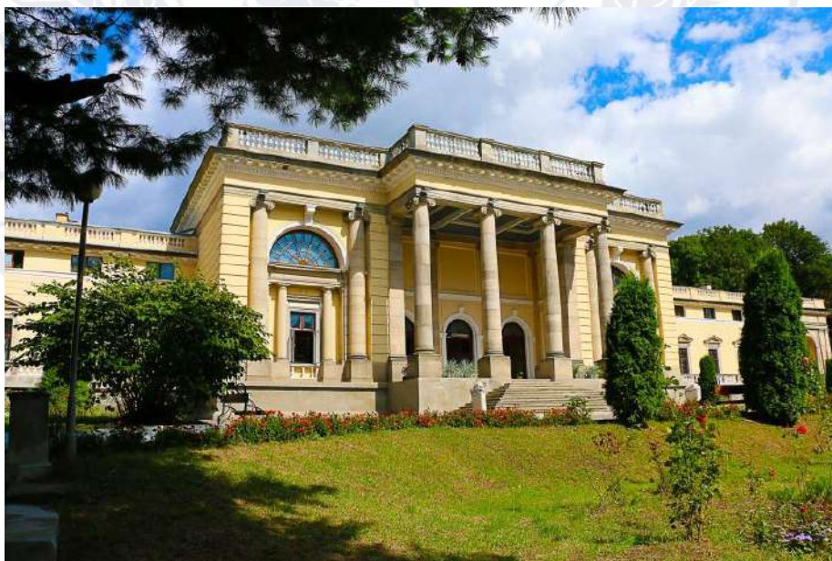
Рис. 6. Палац княгині Марії Щербатової у Немирові (Вінницька область)