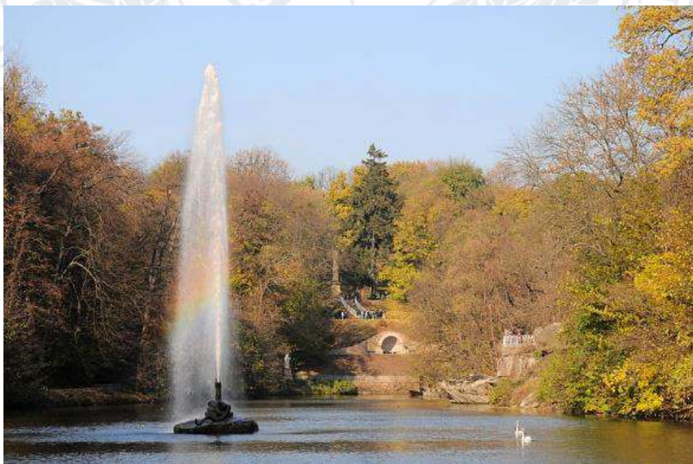
Рис. 16. Софіївський парк місто Умань (Черкаська область)