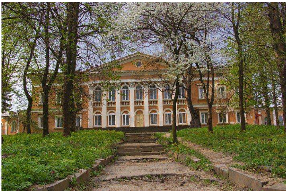
Рис. 13. Палац Потоцьких у с.м.т. Микулинці (Тернопільська область)