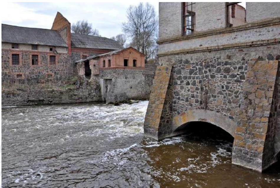
Рис. 11. Водяний млин Потоцького в селі Сокілець (Вінницька область)