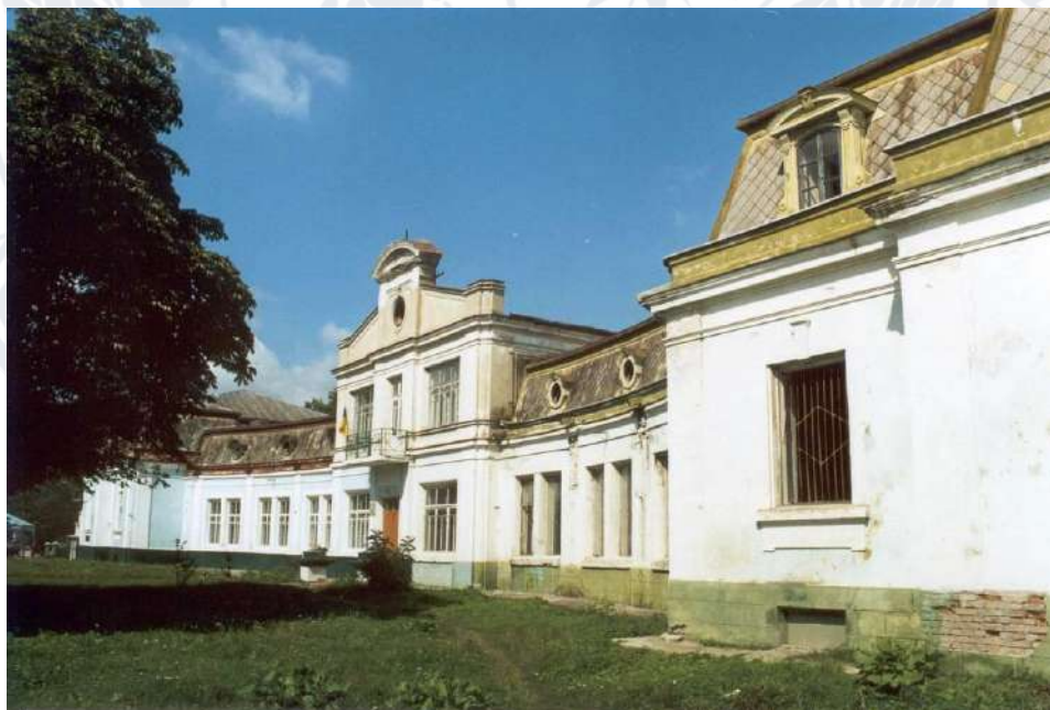
Рис. 12. Маєток Сангушко-Потоцьких у с. Антоніни (Хмельницька область)