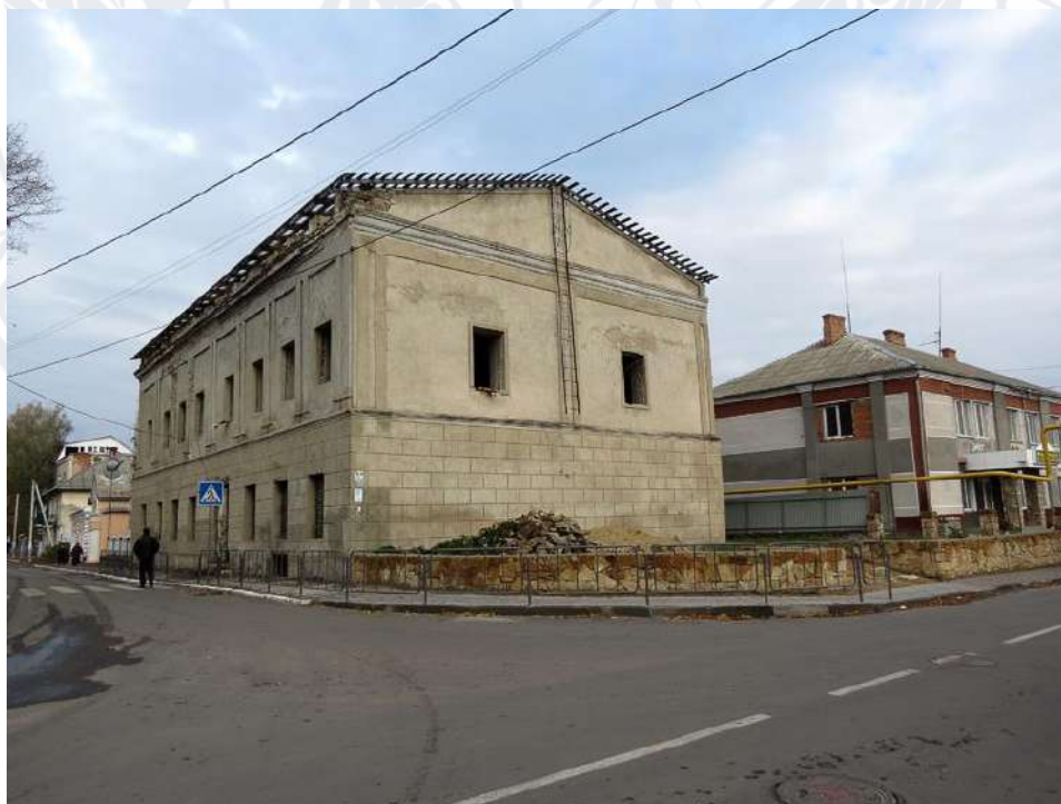
Рис. 10. Будинок Потоцьких в Могилів-Подільському (Вінницька область)