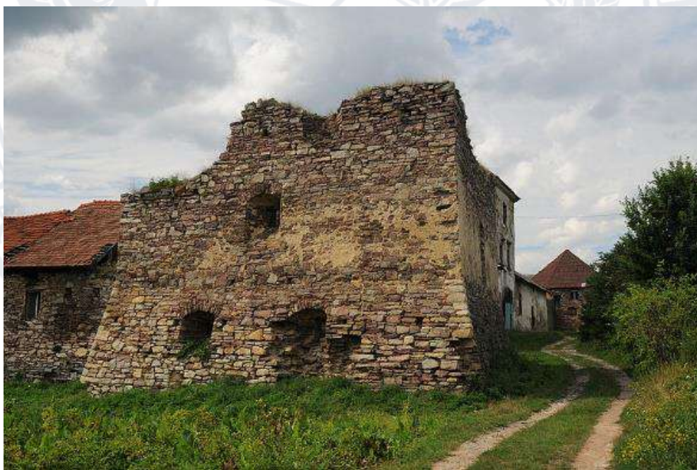
Рис.14. Замок Потоцьких у селі Золотий Потік (Тернопільська область)