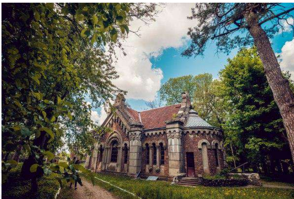
Рис. 9. Мавзолей Потоцьких у с. Печера (Немирівський район, Вінницька область)