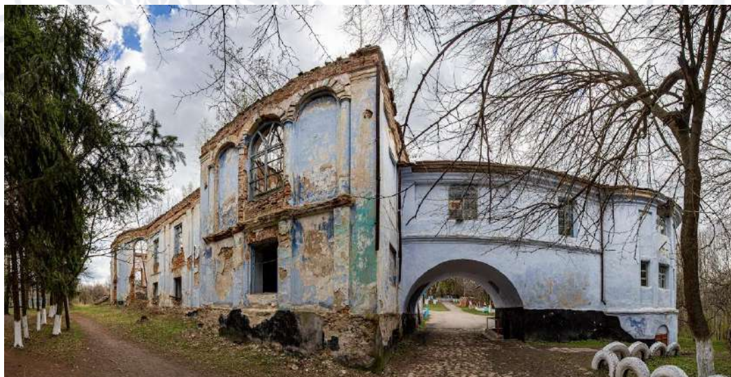
Рис. 8. Палац Потоцьких у с. Дашів (Іллінецький район, Вінницька область)